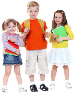
Chris Jamie Robin

(해설) 셋 중에서 가장 키가 큰 사람이 Jamie입니다. 나머지 두 명 중에서는 Robin이 Chris보다 더 키가 큼니다.