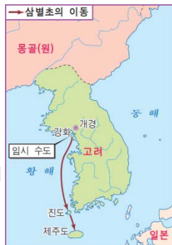
▲ 삼별초의 이동