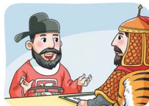
▲ 서희의 담판