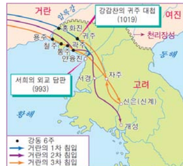
▲ 거란의 침입과 격퇴